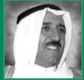
صاحب السمو الشيخ صباح الأحمد الجابر الصباح رئيس مجلس الوزراء