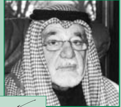
الشيخ أحمد بزيغ الياسين رئيس الهيئة