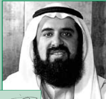
الشيخ الدكتور أنور شعيب عبدالسلام عضو الهيئة