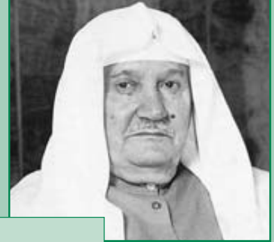
الشيخ الدكتور محمد فوزي فيض الله عضو الهيئة