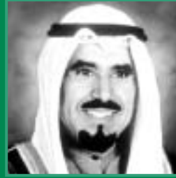
صاحب السمو الشيخ جابر الأحمد الجابر الصباح أمير دولة الكويت