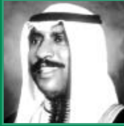
صاحب السمو الشيخ سعد العبدالله السالم الصباح ولي العهد