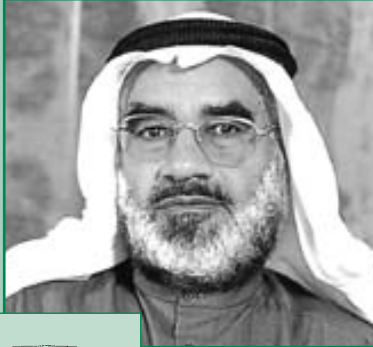
الشيخ الدكتور عجيل جاسم النشمي عضو الهيئة